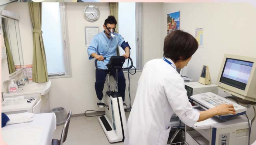
↑ 分析結果により、様々な事がわかります

当院の心臓リハビリは専任医の指導のもと、看護師・理学療法士・他スタッフが連携し、包括的にアプローチします。運動療法、食事療法、生活指導、服薬指導、心理的サポートを行い、在宅復帰のみでなく再発予防を目指します。入院・外来問わず、状態に合わせた心臓リハビリテーションを提供しています。