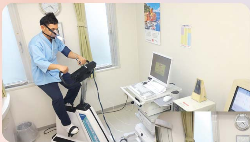
↑ 実際的心肺運動負荷試験の様子

マスクを着けて自転車を漕いでもらいます。検査の所要時間としては準備時間を含め30~50分程度です。検査当日は2時間前より飲食・喫煙は控えて頂きます。激しい運動は当日はお控えください。