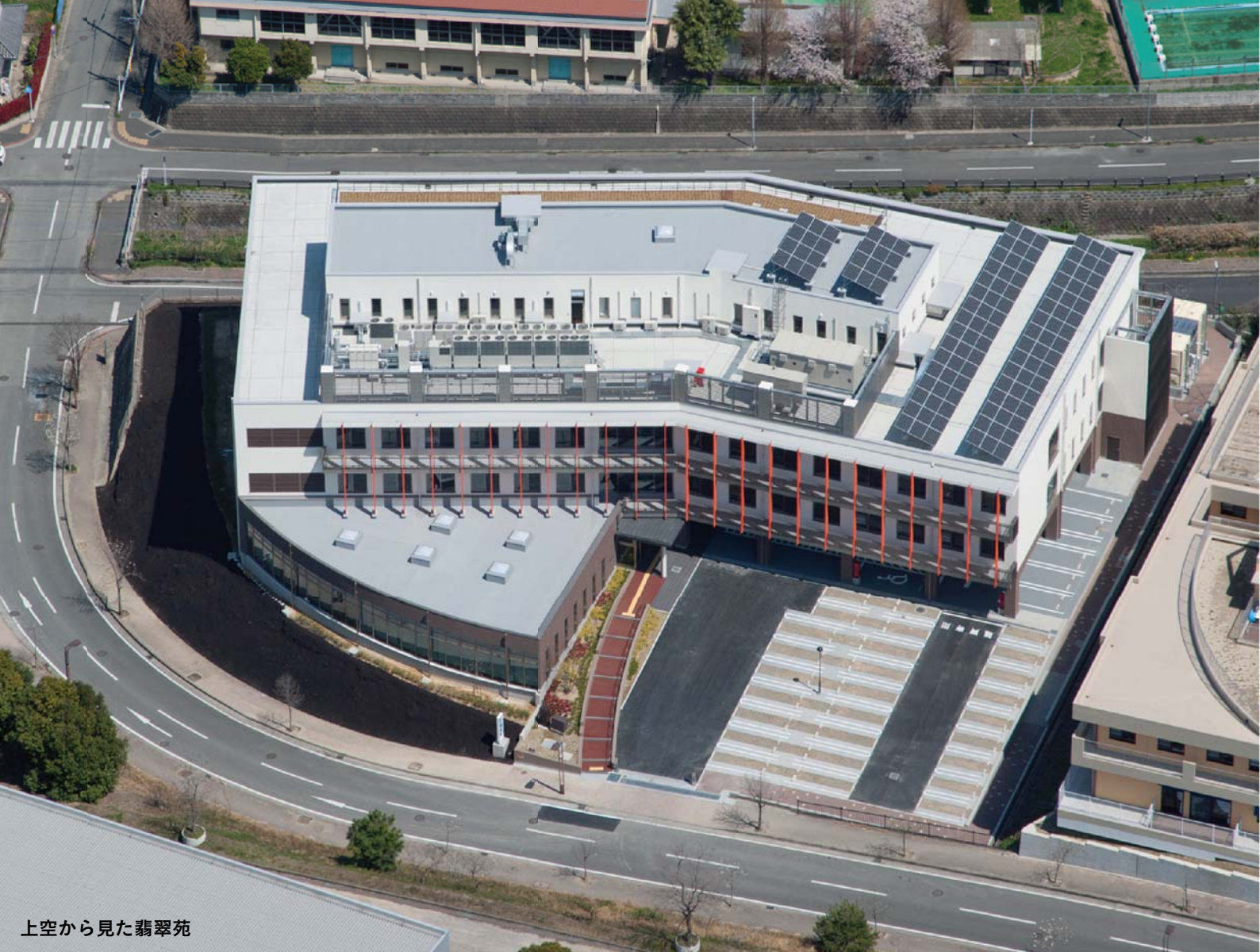
上空から見た翡翠苑

■ KAIHOU: 開放型病院・病気が快方する・良い知らせの快報・患者さんの介抱・計画や考えを心を持つ懐抱等、すべての意味を込めて KAIHOU としました