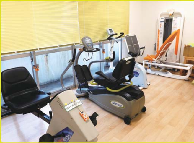
マシーントレーニング