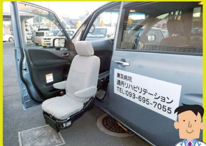
送迎も行っております